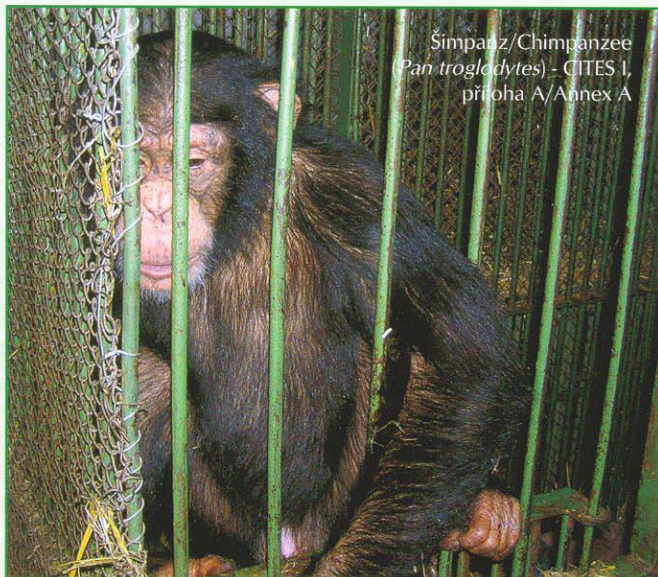
Šimpanz/Chimpanzee ( Pan troglodytes ) - CITES I, příloha A/Annex A

Vytvořit vhodné prostředí pro lidoopy je v soukromých chovech téměř nemožné. Ve volné přírodě jsou čím dál víc ohroženi expanzí svých blízkých příbuzných - lidí.