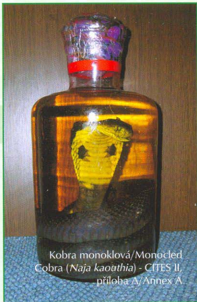
Kobra monoklová/Monocled Cobra ( Naja kaouthia ) - CITES II, příloha A/Annex A

Large iguanas are mostly endangered by hunting for meat, illegal catching for trade and by devastation of natural habitats.