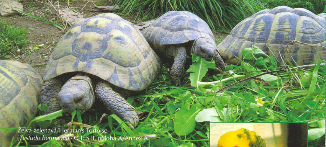
Želva zelenavá/Herman's Tortoise ( Testudo hermanni ) - CITES II, příloha A/Annex A

Suchozemské želvy nelze bez platných dokladů dovážet jako suvenýr z dovolené. Jsou chráněny úmluvou CITES a chovatel vždy musí prokázat jejich legální původ.